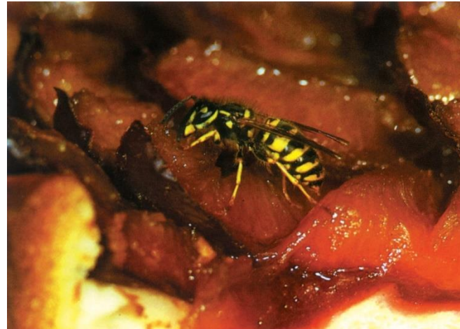
Wenn der Sonntagskuchen auf dem Gartentisch steht, können Deutsche und Gemeine Wespen lästig werden