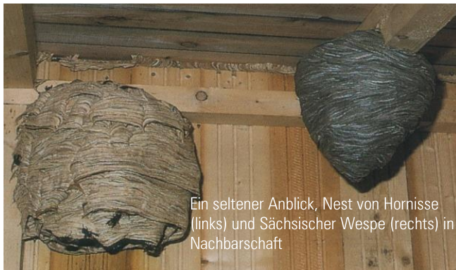
Ein seltener Anblick, Nest von Hornisse (links) und Sächsischer Wespe (rechts) in Nachbarschaft

Wespennester sind einjährig. Jedes Jahr wird ein neues Nest gebaut. Das alte Nest wird aufgegeben und kann im Winter nach mehreren Frosttagen entfernt werden.